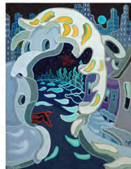
Souvenir de grand-mère, huile sur toile de lin, 76 x 61 cm