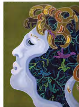
En toute liberté, huile sur toile de lin, 101,5 x 76 cm

Scollard Street Gallery 112 Scollard Street Yorkville, Toronto, On 647.436.9784 www.scollardstreetgallery.com