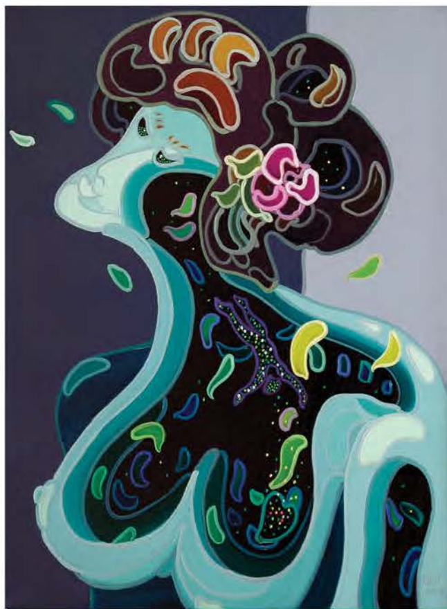
Retour au cœur, huile sur toile de lin, 76 x 61 cm

L'effet visuel est saisissant, mais pour pénétrer complètement dans cet espace pictural et en